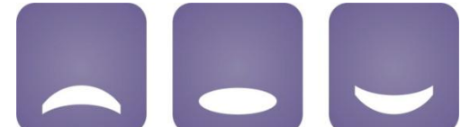
Medijacijski centar Zagreb