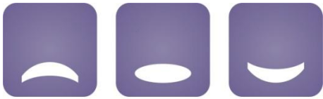
Medijacijski centar Rijeka