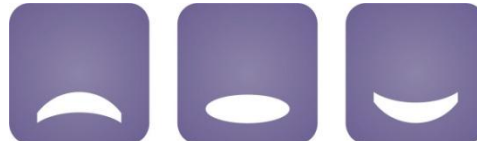
Medijacijski centar V e l i k a G o r i c a